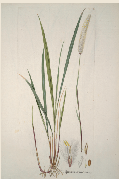
Illustration: Nikolaus Thomas Host/Wikimedia