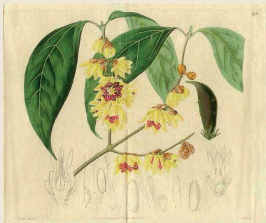
Illustration: Sydenham Teast Edwards/Wikimedia