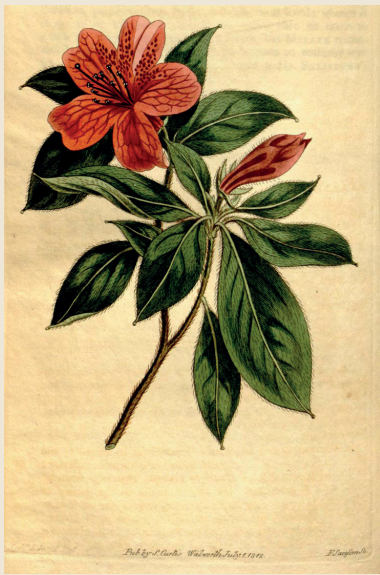
Illustration: Curtis's Botanical Magazine/Wikimeia