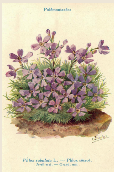
Illustration: J. Eudes/Wikimedia