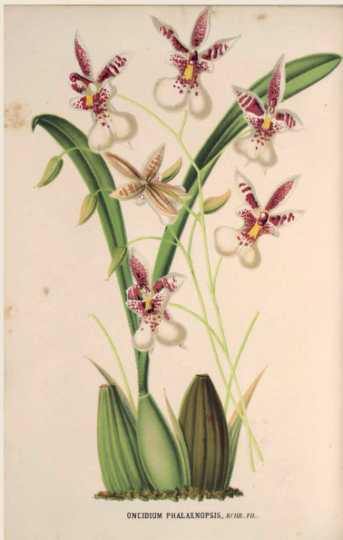
Illustration: L. Stroobant/Wikimedia