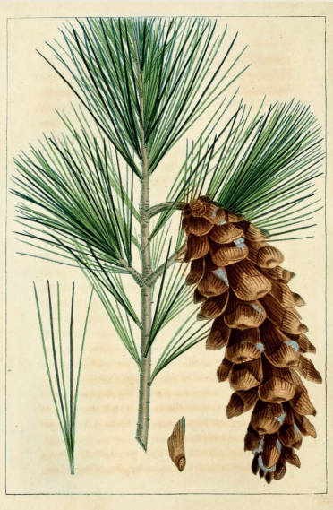
Illustration: Pancrace Bessa/Wikimedia